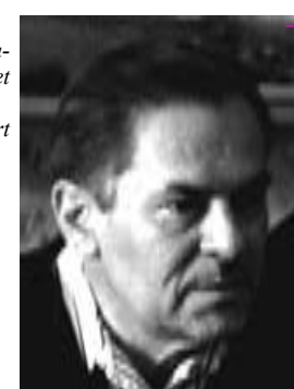
Stanislav Grof (1931-?): Tjekkisk/amerikansk psykiater, medstifter af den transpersonlige psykologi. Se artikel s. 12

Amerikansk filosof og psykolog. Regnes som den første amerikanske psykolog. Gik imod de mere materialistiske strømninger indenfor videnskaben og beskæftigede sig bl.a. med religionspsykologi.