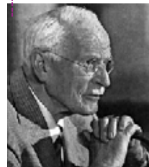
William James (1842-1910):

Jung var den første, som introducerede idéen om arketyper, Selvet og det kollektive ubevidste. Mange af hans ideer blev videreført i den transpersonlige psykologi.