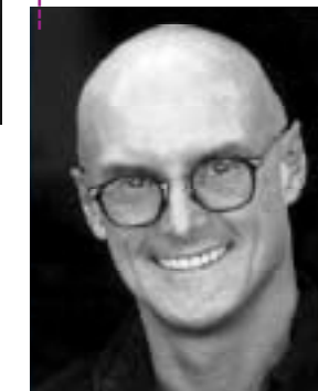
Aldous Huxley (1894-1963): Visionsrig forfatter og filosof. En af de største tænkere i det 20. århundrede.